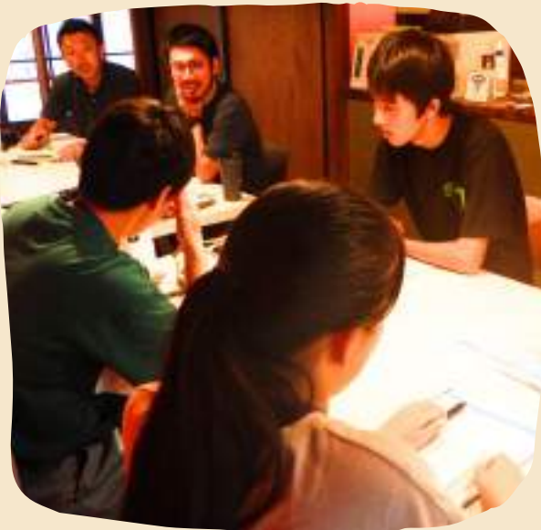
「フィールドワーク②」