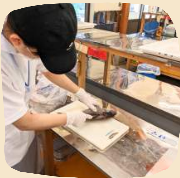
「フィールドワーク①」